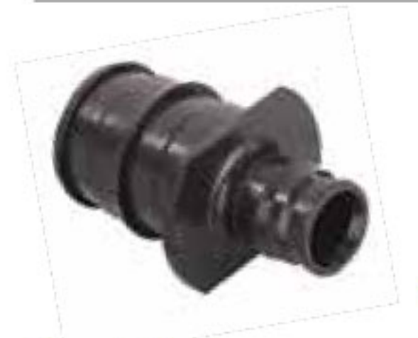
414 تبدیل پلیمری Reducer PN=10bar