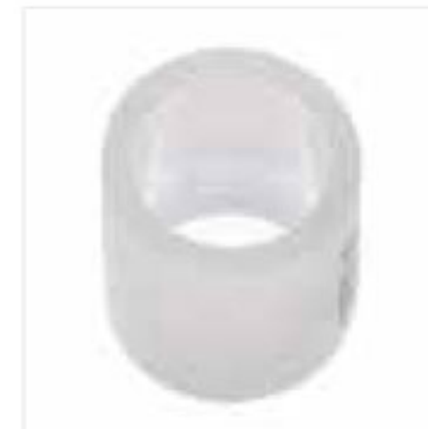
433 حلقه (رنگهای آبی- قرمز- بی‌رنگ) Ring PN=10bar