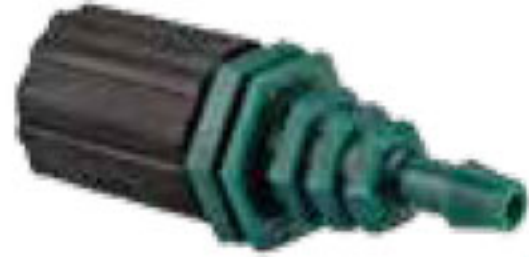
311 دریپر زیتونی