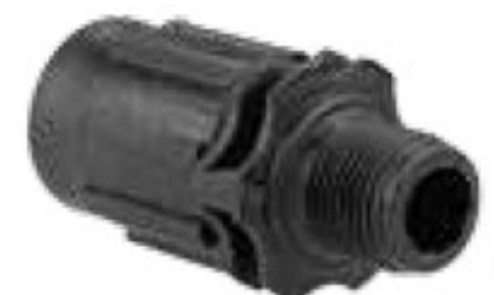
314 رابط تیپ به 1/2"