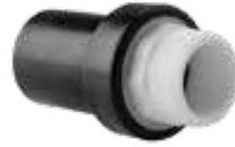
271 اتصال TF پلی اتیلن، برنجی، پلیمری Transition Fittings PN=16bar