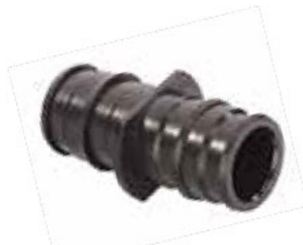
413 رابط پلیمری Coupler PN=10bar