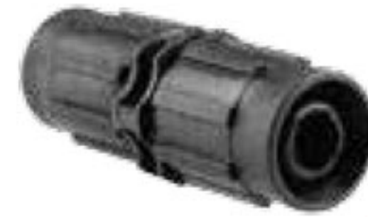
314 رابط تیپ به تیپ