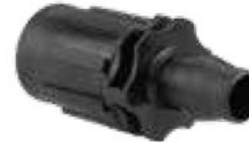
314 رابط تیپ به بست ابتدایی دنده‌ای