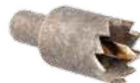
316 سرسته مخصوص بست ابتدایی تیپ