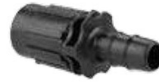
314 رابط تیپ به لوله 16mm