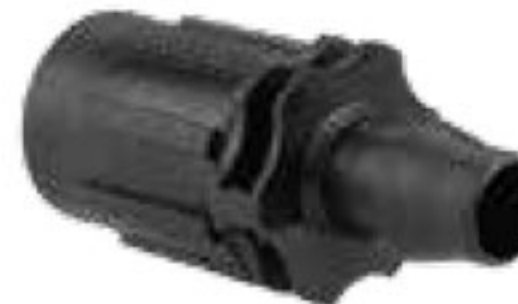
314 رابط تیپ به بست ابتدایی فشاری