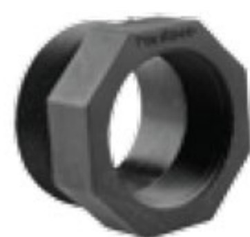
155 تبدیل نر / ماده