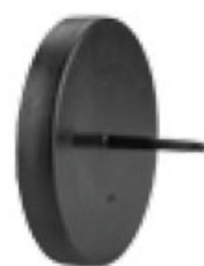
287 درپوش تست | End Plug PN=4bar