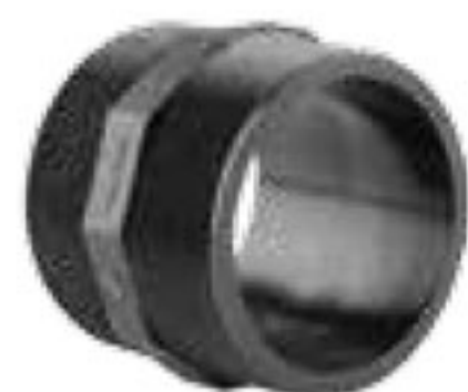
151 مغزی دنده ای