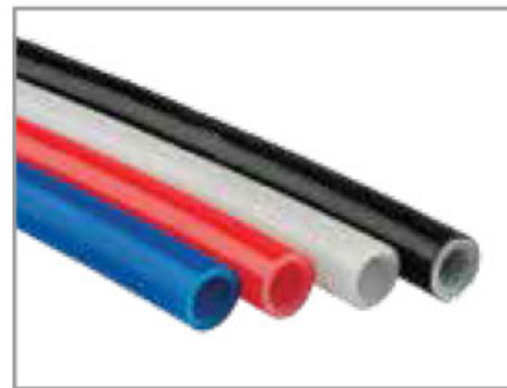
444 لوله PEX-b تک لایه مخصوص آب شرب مصرفی (سرد و گرم) PEX-b Pipe PN=10bar