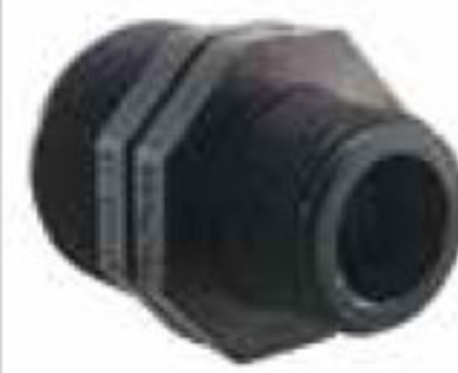
152 مغزی تبدیل