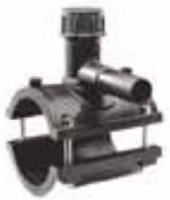
260 زین الکتروفیوژن Tee Tapping Saddles PN=16bar