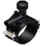
کمر بند (TAPPER)